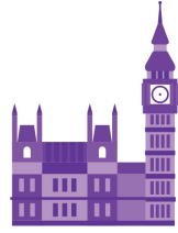
সাধারণ / পাল্লামেন্ট নিরাচন